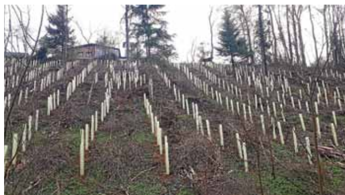
Schozachwäldle: Anbau von Eichen, Elsbeeren und Hainbuchen

Aufmerksame Beobachter werden nach der diesjährigen Frühjahrs-pflanzung überall neu eingesetzte Flächen im Gemeindewald Ilsfeld feststellen. Hintergrund ist der trockene heiße Sommer 2018 und das erhöhte Auftreten von Borkenkäfern. Aber auch das Eschen-