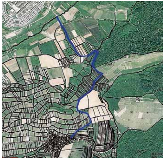
Verlauf der Gemeindeverbindungsstraße von Helfenberg (unterer Bildrand) nach Abstatt-Vohenlohe

Straßenbaulastträger für diese Gemeindeverbindungsstraße ist der Gemeindeverwaltungsverband Schozach-Bottwartal, welcher sich bei der letzten Verbandsversammlung mit einer möglichen Schließung auseinandergesetzt hat. Dem Gemeindeverwaltungsverband gehören die Gemeinden Abstatt, Ilsfeld, Untergruppenbach und die Stadt Beilstein an. Der Streckenabschnitt zwischen Ilsfeld-Helfenberg und Abstatt-Vohenlohe ist sowohl von Pendlern zur Firma Bosch sowie von Freizeitradlern und Fußgängern stark frequentiert. An Sonn- und Feiertagen sowie an Werktagen zwischen 22:00 Uhr und 06:00 Uhr ist der Streckenabschnitt (eigentlich) für den Kfz-Verkehr gesperrt, leider wird diese Anordnung sehr häufig missachtet.