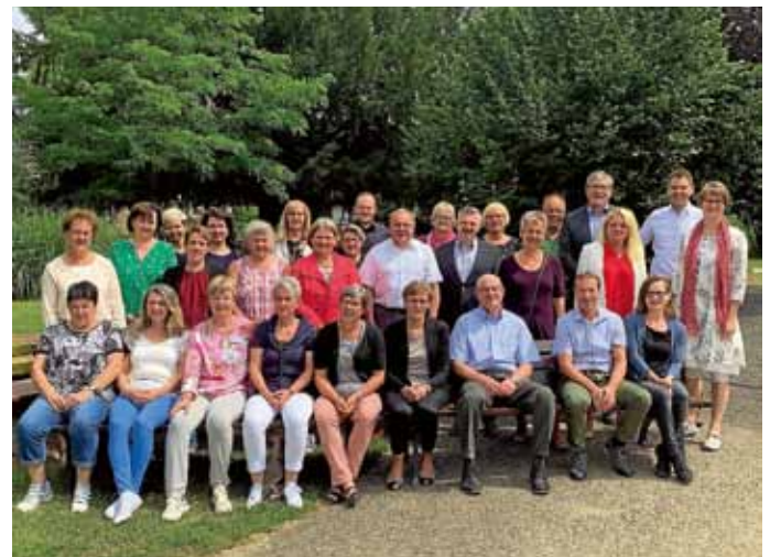
Einsatzleitungen, Pflegedienstleitungen, Geschäftsführerinnen und Geschäftsführer bei der Klausurtagung in Bad Wimpfen

info@diakonie-ilsfeld.de, www.diakonie-ilsfeld.de