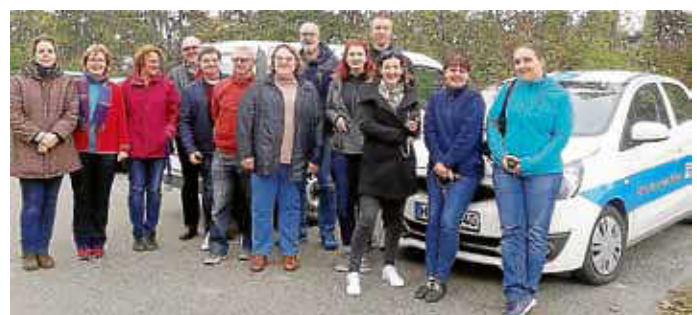
Fahrsicherheitstraining bei der Kreisverkehrswacht Heilbronn, Verkehrsübungsanlage am Wartberg

Haben auch Sie Interesse unser Pflege-Team zu verstärken, dann melden Sie sich als Pflegefach- oder Assistentenkraft jederzeit gern bei uns unter 07062 973050 oder unter info@diakonie-ilsfeld.de