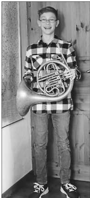
Paul Schramm