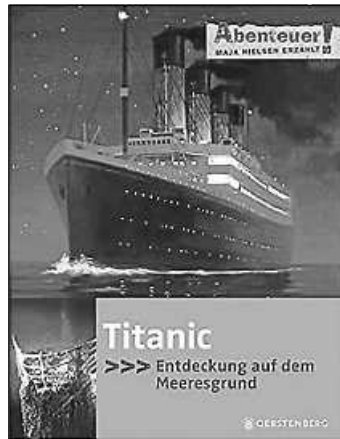
Das spannende Sachbuch zur Titanic Cover: Gerstenberg Verlag

Eintrittskarten zum Preis von 2.50 € gibt es in der Mediothek. Bitte bringt an diesem Tag eure Testnachweise aus der Schule mit.