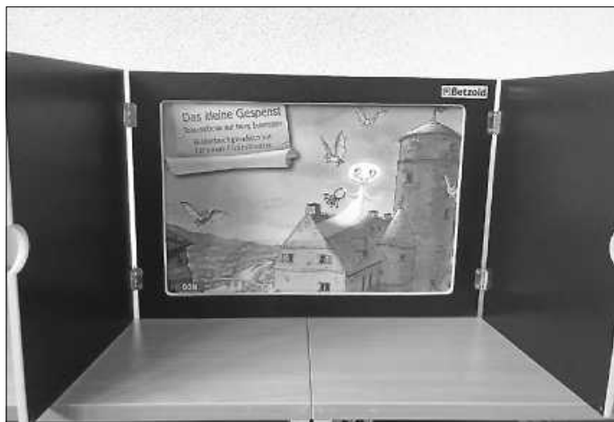
Wie eine kleine Bühne: das japanische Kamishibai-Papiertheater

Es geht los - die Mediothek lädt Kinder ab 4 Jahren zur Lesezirkus-Vorlesestunde mit dem japanischen Papiertheater Kamishibai ein, immer am letzten Donnerstag im Monat. Passend zur Halloween-Zeit lesen wir die Geschichte vom kleinen Gespenst, das Nachtgespenst, das so gerne einmal den Tag erleben will und begleiten es in diesem Abenteuer auf die Geisterstunde durch das Burgmuseum. Vorlesestunde für Kinder ab 4 Jahren. Dauer 30 Minuten. Die Teilnehmerzahl ist begrenzt. Eine Anmeldung in der Mediothek ist erforderlich.