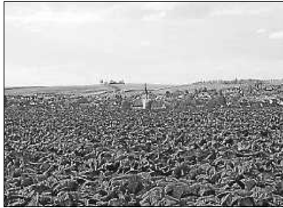
Statt auf der Anhöhe im Norden (Bild) soll die Erweiterung nun in einer Senke weiter südlich realisiert werden.

Das hat der parlamentarische Staatssekretär im Bundesministerium für Verkehr und digitale Infrastruktur (BMVI), Steffen Bilger, dem Ilsfelder Bürgermeister Thomas Knödler jetzt in einem Schreiben mitgeteilt, das der Heilbronner Stimme vorliegt. Statt der bislang vom Regierungspräsidium und der Autobahn GmbH präferierten Erweiterung nach Norden werde nun laut Bilger die Südvariante weiterverfolgt. Beide Optionen liegen auf Ilsfelder Gemarkung.