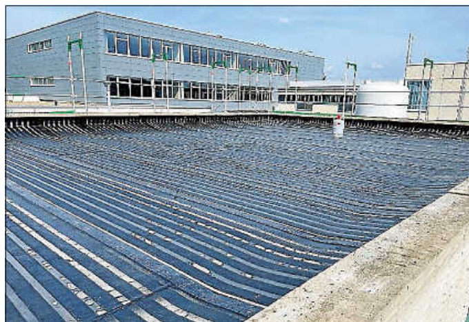
Das Dach musste neu abgedichtet werden.