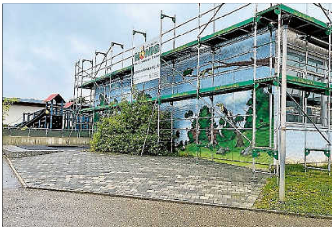
Der Kinderhort „Pusteblume“ wird derzeit saniert.

Die Kostenschätzung beläuft sich auf knapp 900.000 Euro. Im Idealfall, also dann, wenn bis Jahresende alles abgerechnet ist, steuert das Land 625.000 Euro bei. Gut 270.000 Euro finanziert die Gemeinde Ilsfeld selbst. Bis sie in ihr saniertes Domizil einziehen können, werden die Grundschulkindergarten im Kunstsaal der Realschule, Räumen der Freizeitpädagogik und der Grundschule betreut.