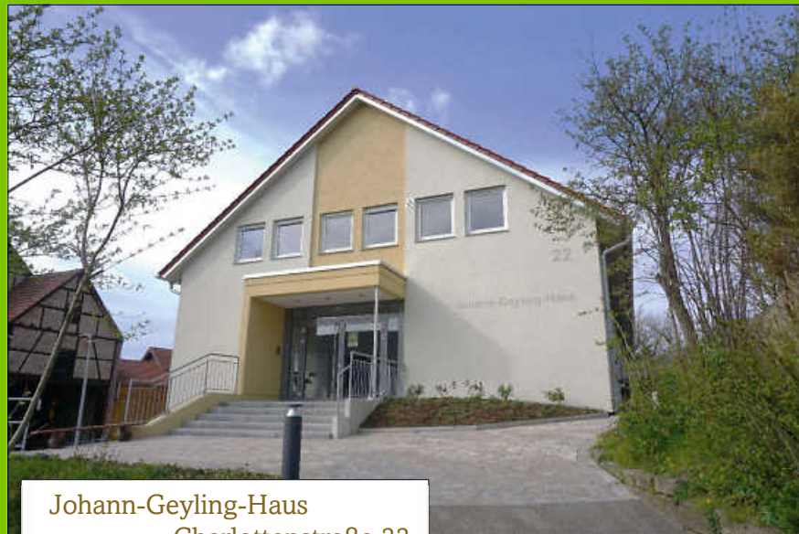
Johann-Geyling-Haus Charlottenstraße 22

Aufgrund der Feierlichkeiten zur Einweihung des Kelterplatzes und der Mediothek