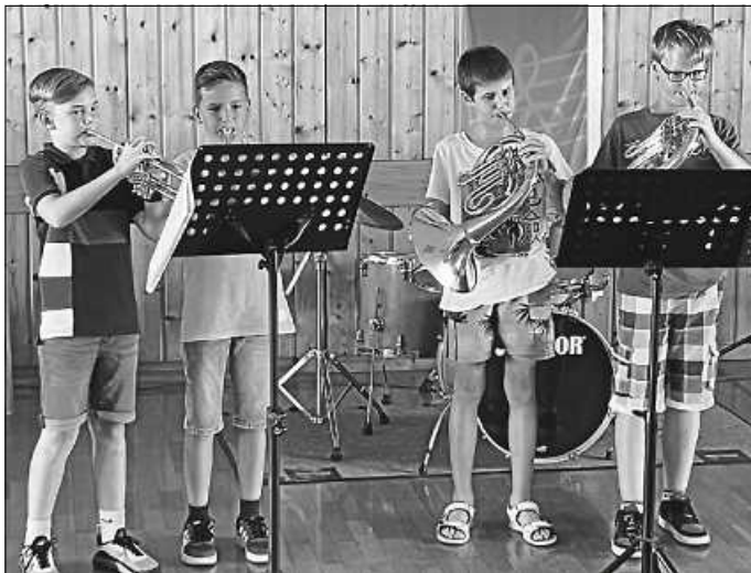
bei der Musizierwoche

Eine erfolgreiche Musizierwoche liegt hinter uns. In vielfältigen Beiträgen zeigten zahlreiche Kinder und Jugendliche Ihr Können.