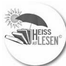
Logo: Regierungspräsidium Stuttgart

Folgen Sie uns doch auch auf Instagram und Facebook unter mediothek.ilsfeld