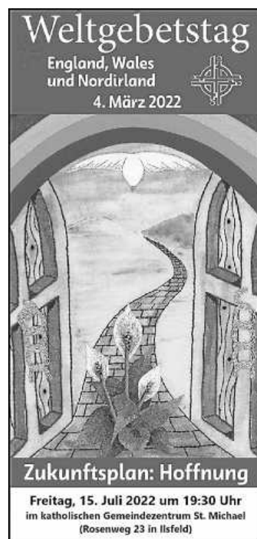
Plakat: KG Ilsfeld, WGT

... ist sonntags nach dem Gottesdienst für interessierte Besucher (zur Besichtigung oder als Raum der Stille) tagsüber geöffnet.