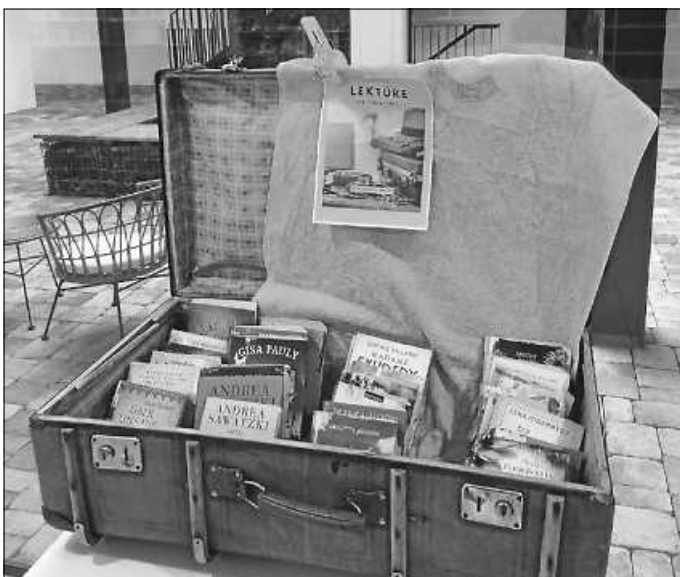
Ein Koffer voll leichter Urlaubslektüre

Übrigens können Sie bei uns auch eBook-Reader vom Typ Tolino entleihen - fragen Sie uns gerne.