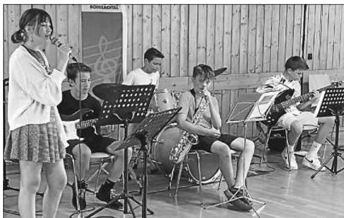
„Washing Machine Heart“

Eine abwechslungsreiche Musizierwoche liegt hinter uns. Täglich fanden Vorspiele statt, in denen sich Groß und Klein präsentieren. Eine kleine Schauspiel-Szene aus dem „Kleinen Prinz“ machte gespannt auf die Theateraufführung im Oktober , ebenso wie die Ausschnitte des Ballettabends im kommenden November .