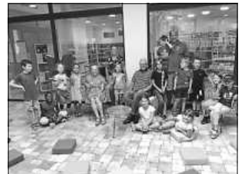
Alle Leseclubkinder und -betreuerInnen

Die letzte Runde des Leseclubs des vergangenen Schuljahrs 2021/22, der einmal wöchentlich in der Mediothek angeboten wird, fand kurz vor den Sommerferien statt. Anlässlich dazu gab es eine kurze Reflektions- und Schreibrunde unter einigen der teilnehmenden Kinder, wie sie den Leseclub interessierten Kindern beschreiben würden und was ihnen am Leseclub gefallen hat.