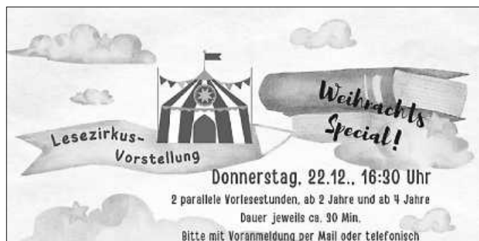
Plakat: Mediothek Ilfeld

Das kleine Rentier als Bilderbuchgeschichte