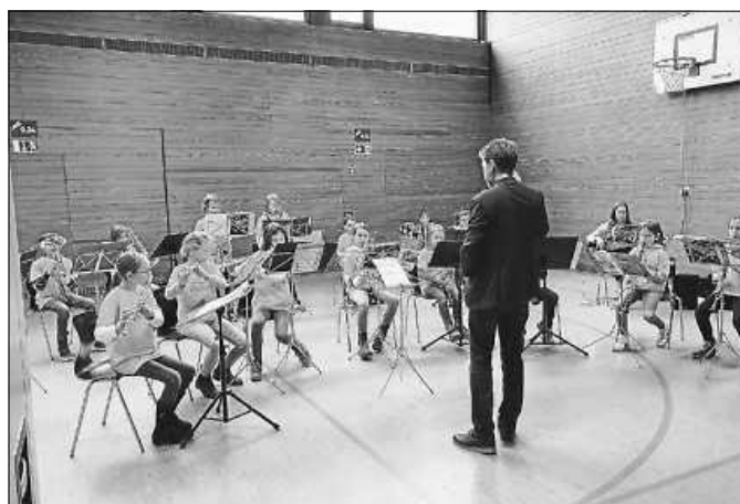
die Bläserklasse Auenstein