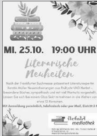
Plakat: Mediothek Ilsfeld

Mit Anmeldung persönlich, telefonisch oder per E-Mail, Eintritt 5 €