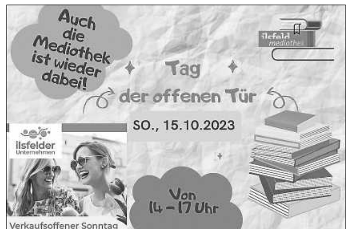
Plakat: Mediothek Ilsfeld

Die Mediothek öffnet am 15.10., am Verkaufsoffenen Sonntag der Gemeinde Ilsfeld von 14 - 17 Uhr ihre Pforten. Nutzen Sie die Möglichkeit, die Räumlichkeiten zu erkunden oder Medien wie gewohnt zurückzugeben oder zu entleihen. Auch auf dem Kelterplatz direkt vor der Mediothek ist wieder einiges geboten.