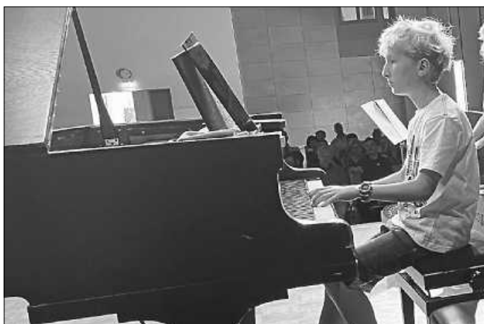
Bach bis Boogie

Im April waren die Streicher auf Probenwochenende auf dem Michaelsberg Cleeborn.