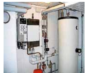
Beispiel einer Übergabestation

Bei aller Freude über das große Interesse an einem Nahwärmeanschluss in Helfenberg wird frühzeitig darauf hingewiesen, dass es im Zuge des Ausbaus auch immer wieder abschnittsweise Vollsperrungen geben wird, um einen raschen Ausbau zu ermöglichen.