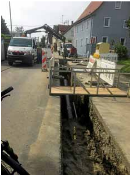
Verlegen von Nahwärmeleitungen in Ilsfeld

Ist es der steigende Ölpreis, ist es der Wunsch nach regenerativen Energien? Völlig überrascht von der großen Nachfrage nach einem Nahwärmeanschluss ist die Gemeindeverwaltung bezüglich des Ortsteils Helfenberg und muss einiges an Umlanungen vornehmen.